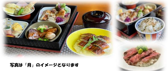
写真は「月」のイメージとなります